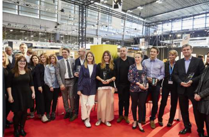
Les membres du jury et lauréats des Trophées de l'innovation 2019

Enfin, le prix « Coup de coeur » a récompensé la société Arper pour sa collection de séparateurs d'espaces acoustiques et astucieux Paravan .